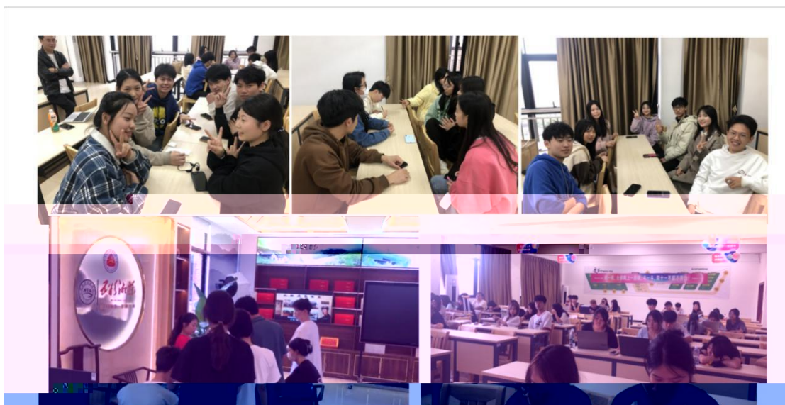
中国欧洲语言选拔赛